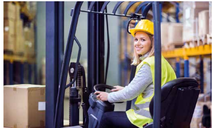
Ausbildung im Rahmen der sogenannten Teilqualifizierung: Mittlerweile stehen 30 verschiedene Berufe aus diversen Branchen zur Auswahl. Dazu gehört auch die Ausbildung zur Fachlageristin.