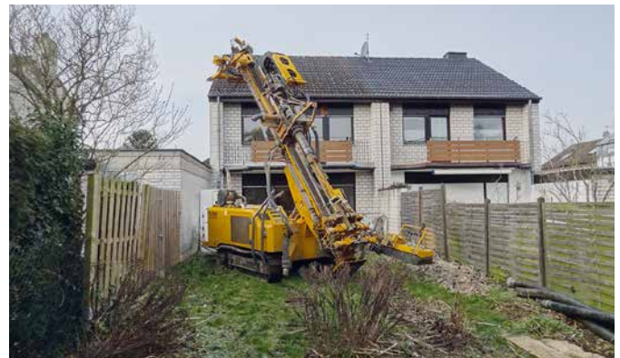
Auch auf kleinen Grundstücken können Tiefenbohrungen stattfinden, um mit kostenloser Erdwärme das Eigenheim über eine Wärmepumpe zu heizen und zu kühlen.

Wärmepumpen schonen das Klima, denn sie nutzen zum Heizen die in Luft, Erdreich und Grundwasser gespeicherte Umweltwärme. Hierfür wird lediglich ein kleiner Anteil Strom für den Antrieb und die Pumpe benötigt. Je mehr grüner Strom eingesetzt wird, desto umweltschonender arbeitet die Wärmepumpe. Und das funktioniert heute auch bei den meisten Altbauten sehr gut. Viele Wärmepumpen in Deutschland nutzen Erdwärme zum Heizen und zur Warmwasserbereitung. Dabei zirkuliert eine Trägerflüssigkeit durch Rohre in die Erde und erwärmt sich. Die aufgenommene Energie wird über einen Wärmetauscher an ein Kältemittel übertragen. Dabei verdampft das Kältemittel, wird verdichtet und erhitzt sich dabei. Ein zweiter Wärmetauscher überträgt diese Wärme dann an den Heizungskreislauf des Hauses. Der elektrische Strom für den Antrieb der Wärmepumpe macht nur einen Bruchteil der erzeugten Wärmeenergie aus. Meist wird die Erdenergie durch eine Tiefenbohrung gewonnen. Spezialgeräte führen Gesteinsbohrungen bis in ungefähr 100 m Tiefe durch. Diese Arbeiten sind in der Regel relativ schnell erledigt. Hierzu Dr. Martin Sabel, Geschäftsführer des Bundesverband Wärmepumpe e. V., „Für eine Bohrung von 100 Metern wird unter normalen Verhältnissen nicht viel mehr als ein Arbeitstag benötigt. Einen weiteren Tag dauert es, bis die horizontale Anbindung und die Befüllung mit Sole fertiggestellt ist. Für diese Arbeiten gibt es die gleichen staatlichen Zuschüsse wie für den