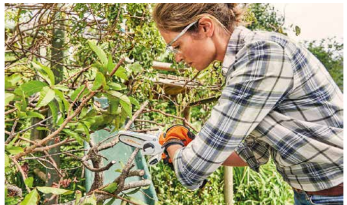
Ein Rückschnitt verhilft den Gehölzen zu neuem, gesundem Wachstum.

werden. Mit Freischneidern wie der Akkusense FSA 57 lassen sich diese Trimmerarbeiten schnell erledigen. Wer sich selbst ein Bild von den vielseitigen Geräten machen will, hat dazu Gelegenheit beim „Stihl Garten-Start“ im örtlichen Fachhandel. Adressen in der Nähe sind unter www.stihl.de zu finden. Hier gibt es auch einen Onlineshop und einen Ratgeberbereich mit weiteren Tipps rund um den Start in die Saison.