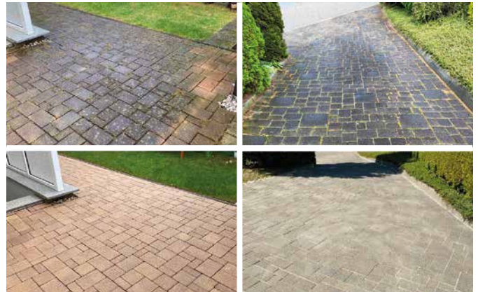
Zwei Steinflächen jeweils vor (oben) und nach der Sanierung (unten).

Aber halt, auch hier sollte man auf einiges achten, es gibt Seriöse, es gibt Unseriöse. Auch die Verfahren unterscheiden sich gravierend: Die Einen sind sehr günstig, kommen auch nur mit