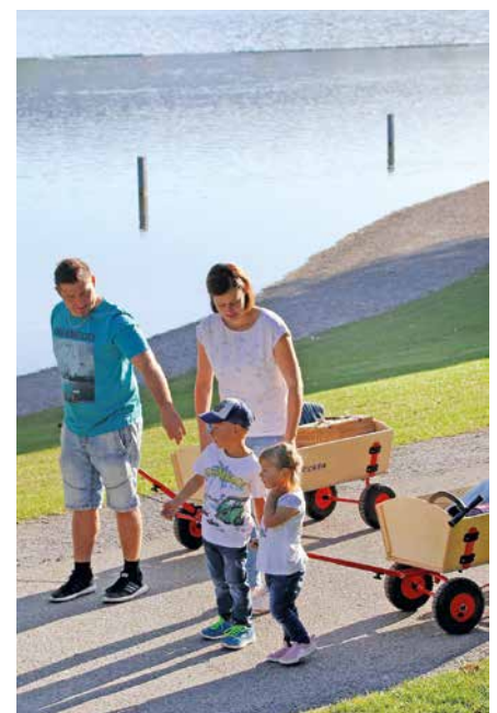
Ein Ausflug mit der ganzen Familie ist ein schöner Zeitvertreib am Wochenende.