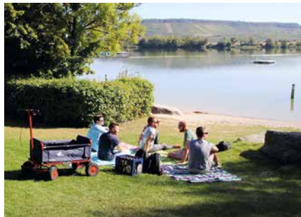
Ein Bollerwagen ist ein praktischer Helfer für den Transport von Getränkekisten, Proviant und Decken.

Für ein Picknick am See oder bei der Vatertagswanderung genügt häufig ein Basismodell. Heutzutage sind Bollerwagen idealerweise mit einer Fahrradzugstange nachrüstbar, sodass sie auch an ein Fahrrad angehängt werden können. Praktisch ist weiterhin ein Planendach, das den Proviant vor kleinen Regenschauern oder starker Sonneneinstrahlung schützt. Zur nächsten Stufe gehören dann Wagenmodelle aus robustem Stoff mit stabilen Querstangen, die man ohne Werkzeug zusammenfalten oder auseinandernehmen kann. Sie sind leicht, passen