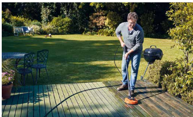
Einmal saubermachen, bitte! Ein Hochdruckreiniger bringt die Terrasse schnell und bequem wieder zum Strahlen.