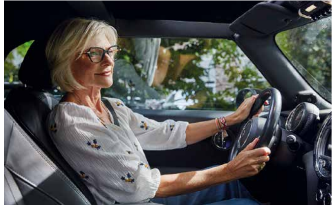
Spezielle Brillengläser für Autofahrer sorgen bei allen Sichtverhältnissen für blendfreies Sehen – selbst bei Dämmerung und Dunkelheit oder beim Wechsel zwischen hell und dunkel.